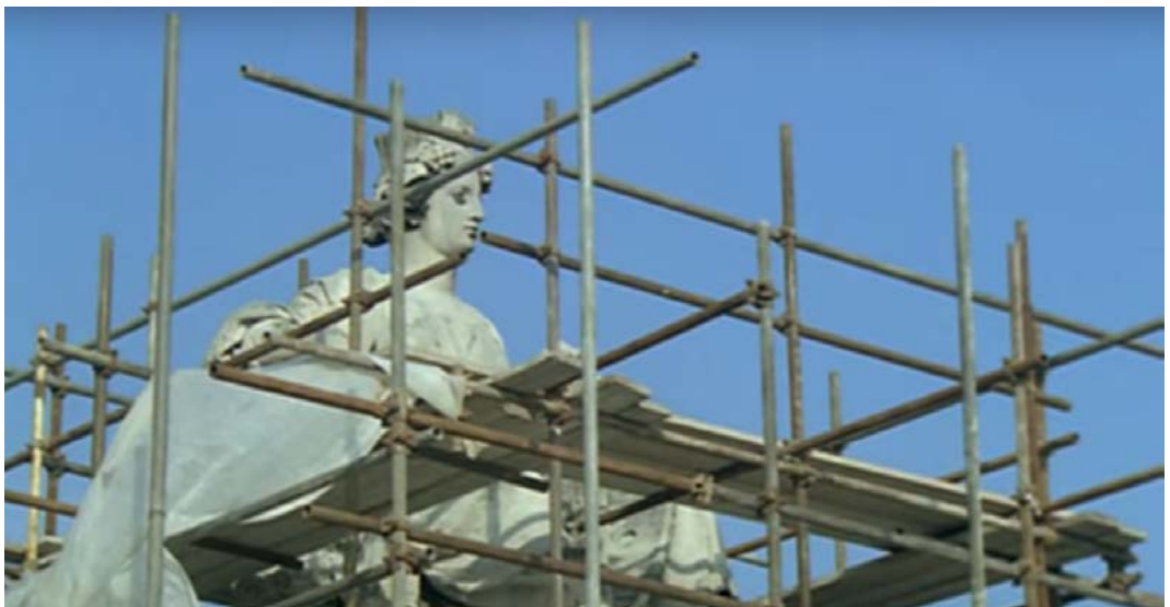
Image extraite du court-métrage Césarée de Marguerite Duras