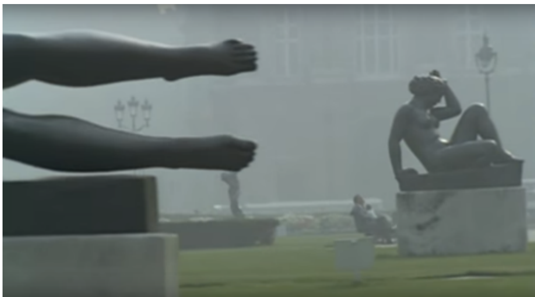
Image extraite du court-métrage Césarée de Marguerite Duras